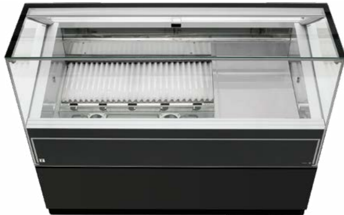
Hybrid Cooling Technology: accumulatore di freddo Hybrid Cooling Technology: acumulador de frío