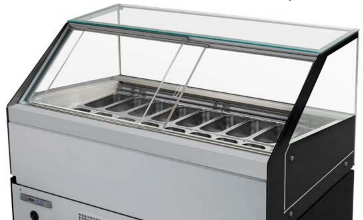
Guide degli scorrevoli integrate nel piano lavoro Guías deslizantes integradas en la encimera