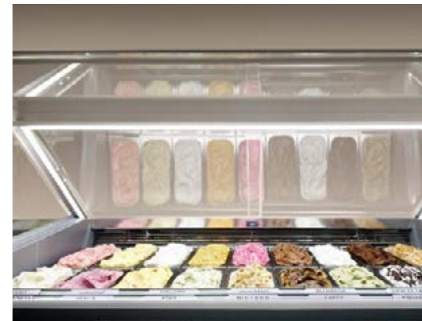
illuminazione perimetrale a LED 4000K Iluminación perimetral de LED 4000K

El gran cristal frontal piroclítico calefactado y templado, garantiza una transparencia extrema, libre de condensación, que destaca tu gelato. El marco de luz LED, perimetral e integrada, resalta aun más tus creaciones convirtiéndolas en protagonistas.