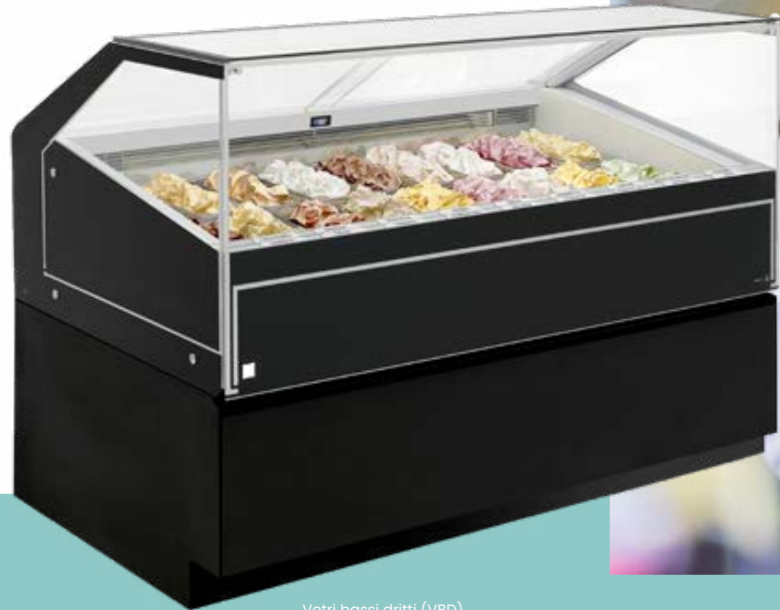
Vetri bassi dritti (VBD) Vidrios bajos rectos (VBD)