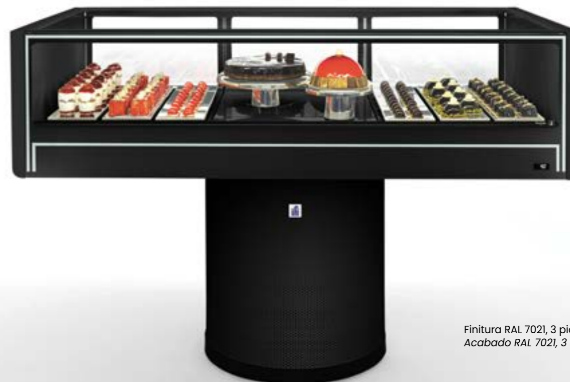
Finitura RAL 7021, 3 piani espositivi Acabado RAL 7021, 3 bandejas