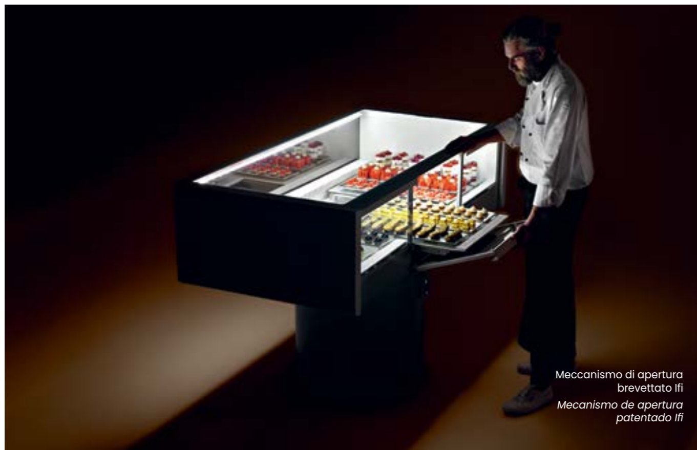
Meccanismo di apertura brevettato Ifi Mecanismo de apertura patentado Ifi