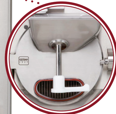
portello Elite Elite door