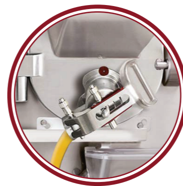
uscita laterale side exit

Compacta VariO - Il sistema Compacta VariO produce gelati dalla consistenza perfetta, sia con miscele ricche sia con miscele delicate, sia ai massimi regimi produttivi sia con cariche ridotte a quantità minime. Compacta VariO - The Compacta VariO system always makes gelato with perfect consistency, both for rich and delicate mixes, at maximum production and minimum capacity.