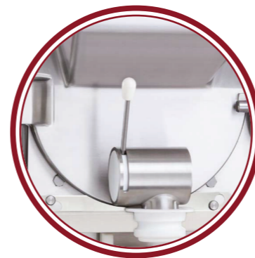
uscita singola single exit