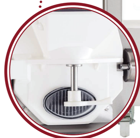
portello Classic Classic door