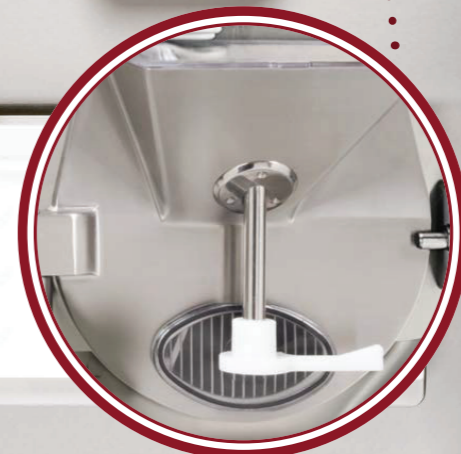
portello Silver Silver door