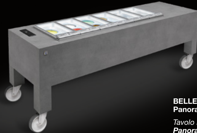
BELLEVUE table with one-level Panorama tank

Tavolo BELLEVUE con vasca Panorama senza riserva