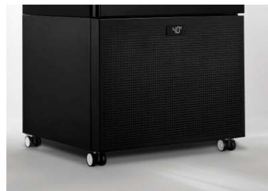
4 pivoting wheels with locking system 4 roues pivotantes avec système de verrouillage