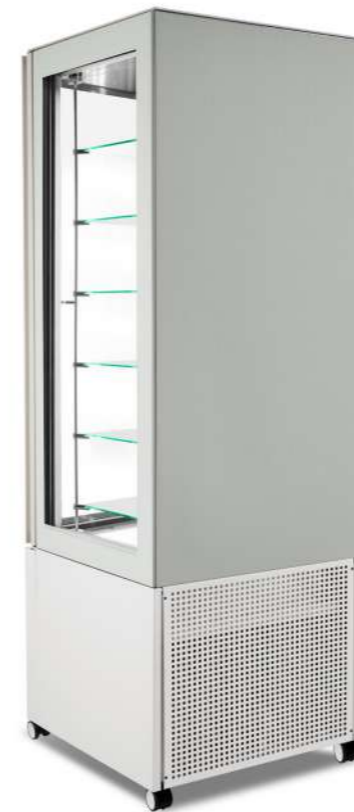
Pivot 3-sides Pivot 3 côtés