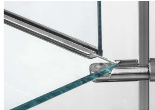
Newly developed shelf fixing system Nouveau système de fixation des tablettes

Chaque élément de Pivot est conçu pour vous offrir un niveau de confort supérieur et une attention maximale aux détails.