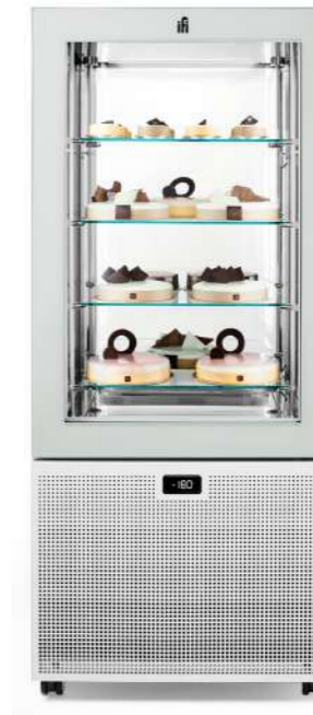
Pivot H 61.02" Pivot H 1550 mm