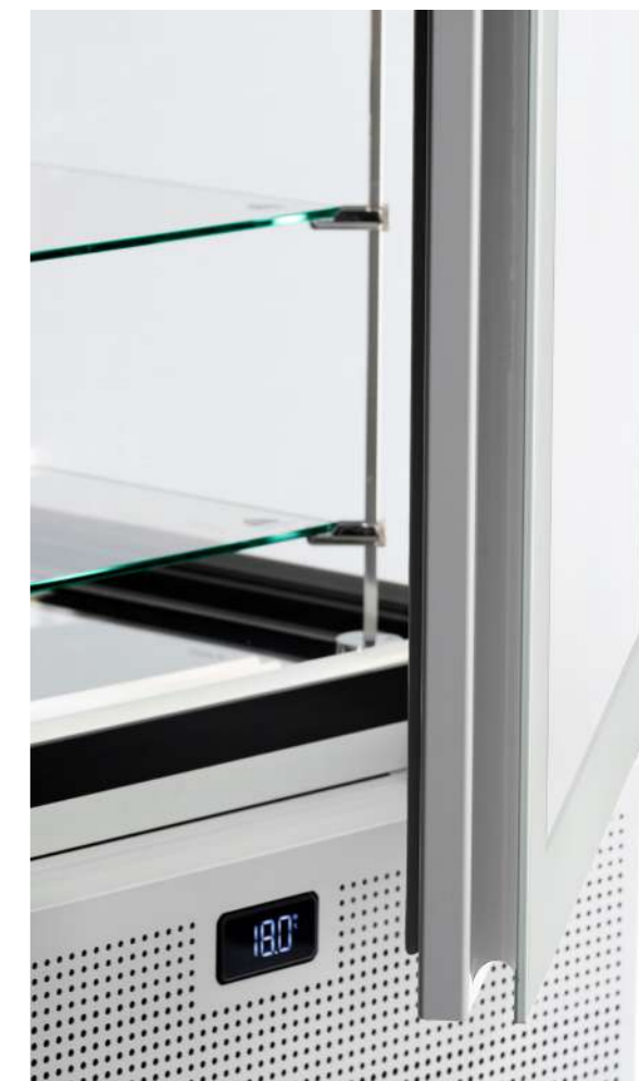
Integrated handle and full touch electronic display Poignée intégrée et écran électronique tactile

Dans la version ventilée (H 1900 mm), les 6 niveaux d'exposition permettent une utilisation maximale de l'espace grâce à l'évaporateur intégré dans la base, ce qui se traduit par une exposition encore plus généreuse et sans barrières, pour une propreté formelle qui fait de Pivot un objet de design unique.