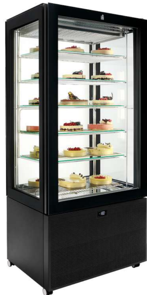
Static Pivot H 74.80" Pivot statique H 1900 mm