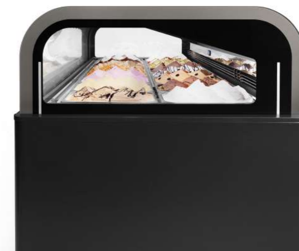
Piano orizzontale e rialzato Parte superior horizontal y elevada

In Esedra, il sistema di refrigerazione ventilata con doppio evaporatore, il flusso sopraelevato dell'aria e le esclusive tecnologie Ifi , come il sistema HCS, proteggono la qualità dei tuoi alimenti, riducono il consumo energetico e tutelano l'igiene. HCS (Hi-Performance Closure System) : il sistema di chiusura posteriore ad alte prestazioni rileva il tempo effettivo di apertura della vetrina, riducendo gli sbrinamenti al minimo necessario, con importanti vantaggi per la qualità del gelato, l'efficienza energetica e l'igiene . Nella versione HCS PRO (con pannello) l'isolamento termico è ancora più performante. Nel servizio Pasticceria , l'impianto refrigerante garantisce l'umidità ideale del 70%. Esedra Pralineria , dotata di controllo d'umidità, può essere convertita in servizio Pasticceria.