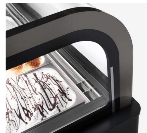
Ripresa dell'aria nascosta Recuperación del aire oculto

En Esedra, el sistema de refrigeración ventilada con doble evaporador, el flujo de aire superior y las tecnologías exclusivas de Ifi , como el sistema HCS, protegen la calidad de sus alimentos, reduciendo el consumo de energía y protegiendo la higiene. HCS (Hi-Performance Closure System) : el sistema con la ayuda de un sensor integrado, detecta el tiempo real que la vitrina está abierta, reduciendo la descongelación al mínimo necesario, con importantes ventajas para la calidad del gelato, la eficiencia energética y la higiene . En la versión HCS PRO (con panel), el aislamiento térmico es aún mejor. En el servicio de Pastelería , el sistema de refrigeración garantiza una humedad ideal del 70%. Esedra Chocolate , equipada con control de humedad, puede convertirse en un servicio de pastelería.