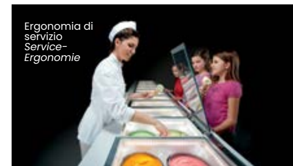
Ergonomia di servizio Service-Ergonomie