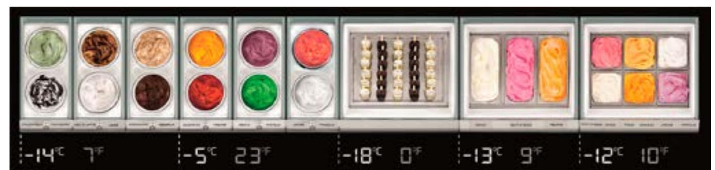
Gestione della temperatura Temperaturverwaltung