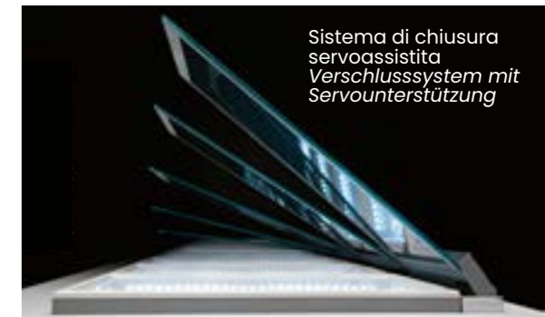
Sistema di chiusura servoassistita Verschlussystem mit Servounterstützung

In Panorama® befreit die Transparenz der beheizten, pyrolytisch beschichteten Scheiben das Eis von den klassischen Gefrierdeckeln und sorgt für eine perfekte Sicht , die das Farberlebnis des Eises mit höchsten Konservierungsstandards vereint. Der 4000K LED-Innenrahmen lässt Ihre Kreationen noch besser zur Geltung kommen, und die vielfältige Auswahl an Zubehör gibt Ihnen große Freiheit bei der Präsentation.