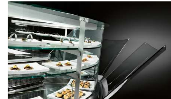
Vetri alti dritti (VAD) Vidrios altos y rectos (VAD)