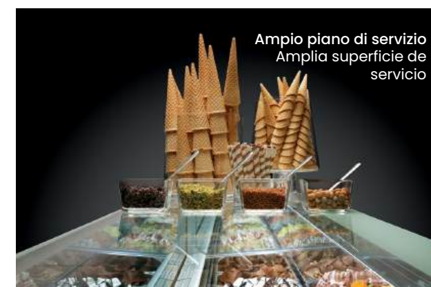
Ampio piano di servizio Amplia superficie de servicio