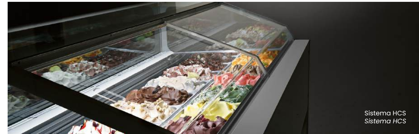
Sistema HCS Sistema HCS

El exclusivo sistema de cierre trasero de alto rendimiento HCS (Hi-Performance Closure System), con la ayuda de un sensor integrado, minimiza el número de desescarches en función del tiempo real de apertura de la vitrina y limita el acceso de aire exterior sólo en el momento de servir, en beneficio de la calidad de conservación del gelato, la higiene y ahorro de energía .