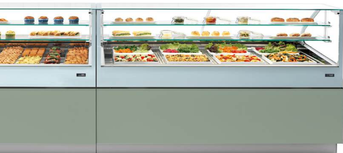
Snack freddo/caldo Snack frío/caliente