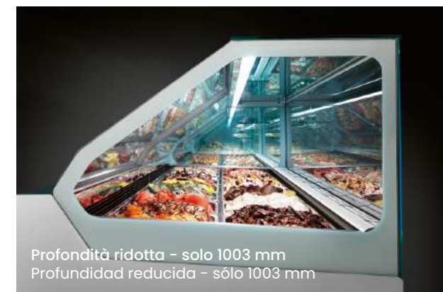
Profondità ridotta - solo 1003 mm Profundidad reducida - sólo 1003 mm