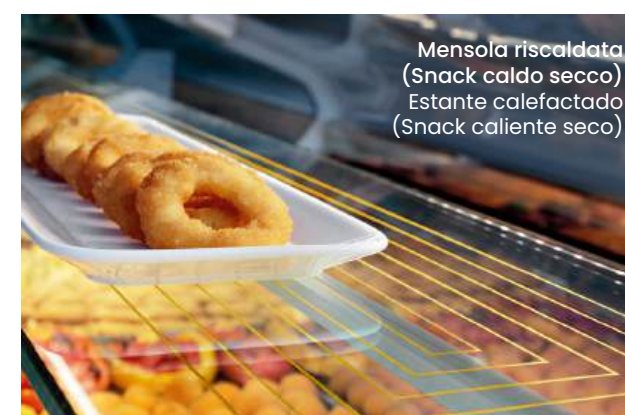
Mensola riscaldata (Snack caldo secco) Estante calefactado (Snack caliente seco)

Ogni elemento di Sam80 Air è pensato per offrirti un livello superiore di finitura e massima cura dei particolari.